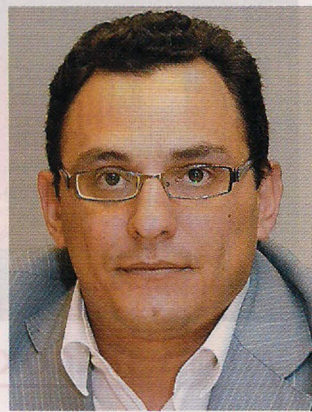
Ο Σωτήρης Ζωντός βρίσκεται στη δεύτερη θητεία του στον προεδρικό θώκο του Πανελληνίου Συλλόγου Μηχανικών Παραγωγής και Διοίκησης.

Στη Γενική Συνέλευση προσήλθαν πολλά μέλη και συζητήθηκαν όλα τα τρέχοντα θέματα του Συλλόγου, λαμβάνοντας αποφάσεις τόσο για τα τρέχοντα προβλήματα όσο και για τους μελλοντικούς στόχους και σκοπούς του Συλλόγου. Αξίζει να σημειωθεί ότι το ξενοδοχείο Athens Acropolis Hotel βοήθησε το Σύλλογο στη διεξαγωγή της Γενικής Συνέλευσης, παρέχοντας μια αίθουσα με όλη την απαιτούμενη υλικοτεχνική υπο-