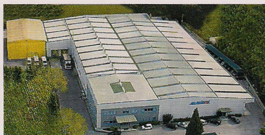
Οι εγκαταστάσεις της Aluminox στο Κορωπί.

Η δομή της εταιρείας είναι ιδιαίτερα ισχυρή και το προσωπικό που διαθέτει είναι απόλυτα εξειδικευμένο με άψογη τεχνογνωσία. Η διοίκησή της απαρτίζεται από άτομα με πολυετή εμπειρία και υψηλό επίπεδο μόρφωσης. Συγκεκριμένα, ο κ. Παναγιώτης Χειλαδάκης, που είναι ο πρό-